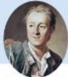
Denis Diderot (1713-1784)

Écrivain et philosophe, il défend l'éducation et l'égalité entre les êtres humains.