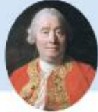
David Hume (1711-1776)

Médecin et savant, il crée une méthode pour analyser et classer les espèces animales et végétales.