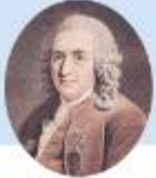
Carl von Linné (1707-1778)

Médecin et savant, il crée une méthode pour analyser et classer les espèces animales et végétales.