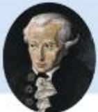
Emmanuel Kant (1724-1804)

Écrivain et philosophe, il codirige l' Encyclopédie et défend le gouvernement du peuple.