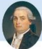
Cesare Beccaria (1738-1794)

Philosophe, il affirme que la raison est le meilleur moyen de penser librement.